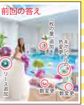
写真:ベルヴィ郡山館(福島)