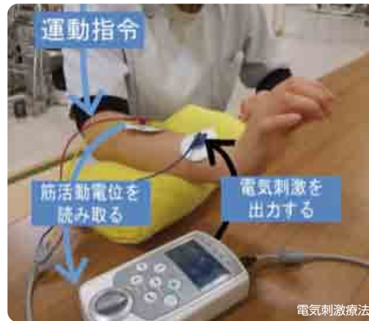
運動指令 筋活動電位を読み取る 電気刺激を出力する