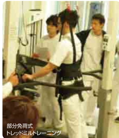
部分免荷式 トレッドミルトレーニング

■ 脳卒中の発病予防・再発予防に向けて 脳卒中において予防が重要であることは言うまでもありません。脳卒中は肥満や高血圧、脂質異常症、糖尿病などいわゆる「メタボリックシンドローム」が発病リスクの一つと言われております。通常、検診などで指摘されたり、指導を受けたりすることは多いかと思いますが、最も重要なことは運動の機会を確保することです。当院では疾病予防運動施設を平成27年1月より開設して、医療機関が運営する運動施設を始めました。ここでは、理学療法士や健康運動指導士など運動の専門家が常駐しており安心かつ効果的なアドバイスが誰でも受けられます。また、28年4月より指定運動施設法の認可を受け、生活習慣病の方が医師からの運動処方をしてもらうことで、会費自体が医療費控除の対象となります。大きな病気につながる前に是非一度ご相談下さい。