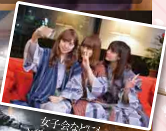
女子会などにも お得なプランをご用意！